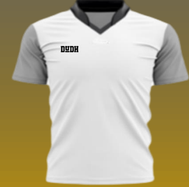
Musclefit Kurz- oder langarm