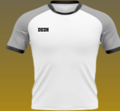
Bundesliga Kurzarm Erwachsene / Kinder