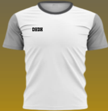
Standard Kurz- oder langarm Erwachsene / Kinder