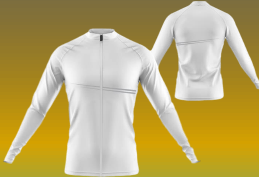
Trainingsjacke mit oder ohne Kapuze